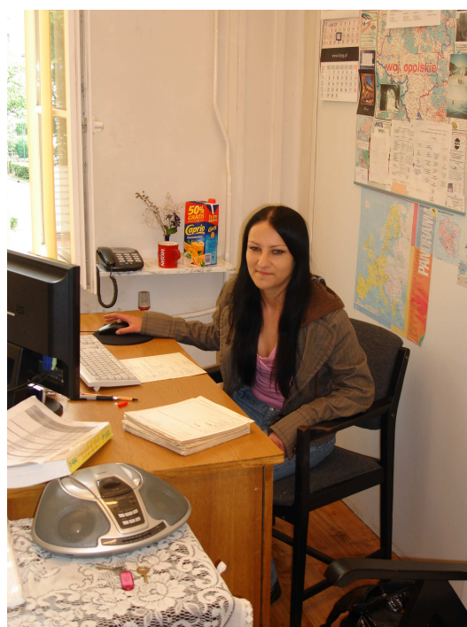
Prace Interwencyjne w Urzędzie Miasta w Brzegu