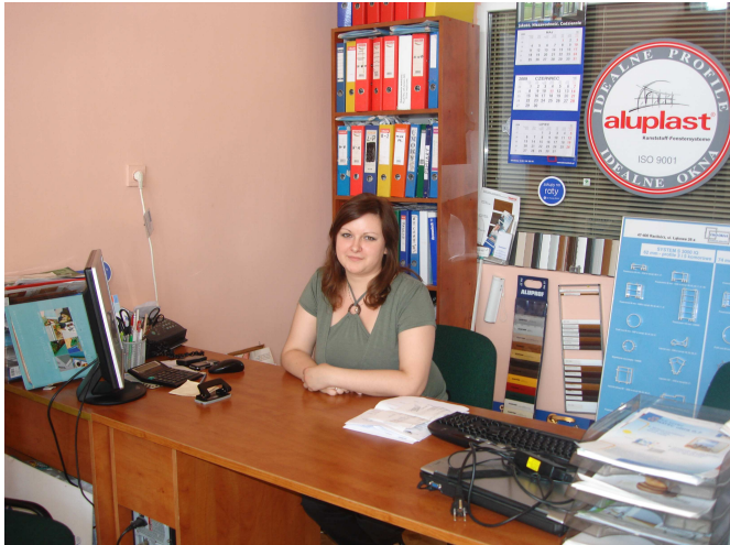
Staż w firmie ECO-STYL TECHNOLOGY w Grodkowie