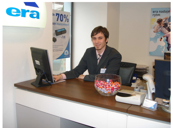
Staż w ERA GSM w Brzegu