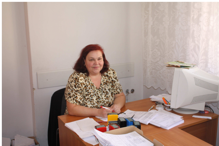
Przygotowanie zawodowe w MZMK w Brzegu