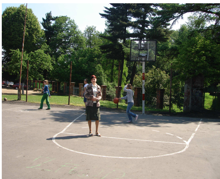
Roboty Publiczne w Publiczna Szkoła Podstawowa Nr 1 w Brzegu