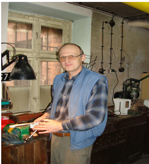
Staż w Zespole Szkół Ekonomicznych w Brzegu